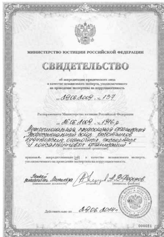
Рис. 1. Свидетельство об аккредитации юридического лица в качестве независимого эксперта, уполномоченного на проведение экспертизы на коррупциогенность

В число экспертов включено свыше 600 физических и более 100 юридических лиц. Среди них: аудиторские организации, консалтинговые компании, оценочные фирмы, юридические компании, коллегии адвокатов, академии (в т. ч. юридические), государственные образовательные учреждения высшего профессионального образования, исследовательские институты, муниципальные учреждения, фонды (в т. ч. земельно-правовые, общественные и др.), правозащитные организации, торгово-промышленные палаты, саморегулируемые организации, отраслевые ассоциации, профессиональные союзы (в т. ч. Общероссийское объединение профсоюзов). Одним из первых «Свидетельство об аккредитации юридического лица в качестве независимого эксперта, уполномоченного на проведение экспертизы на коррупциогенность» получил Профессиональный союз работников аудиторских, оценочных, экспертных и консалтинговых организаций (рис. 1).